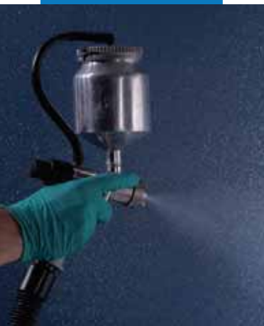
Финишная обработка с помощью Silancolor Topachino с MapeLux Lucida и MapeGlitter, цвет Silver